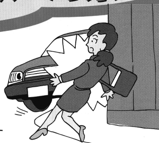
勤務先からの帰宅途中、交通事故に 巻き込まれてしまった。