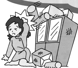
業務中、上からモノが落ちてきた。