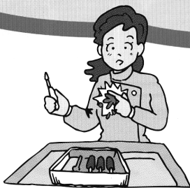
医療器具などを取り扱っている中 ケガをしてしまった。