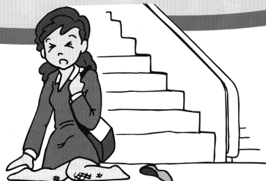
通勤中に駅の階段から足を踏み外した。